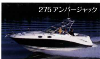
275 アンバージャック